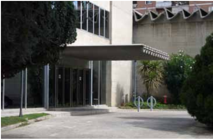
20 Centro de Estudios Hidrográficos, 1960-1963 Address: Paseo bajo de la Virgen del Puerto 3