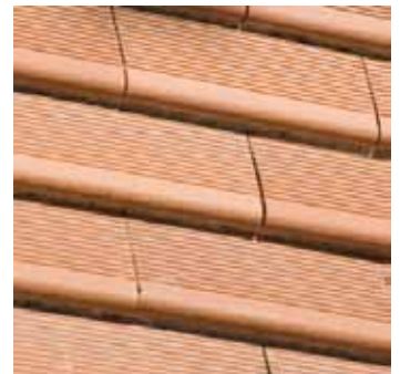
Baksteen - Instituto de Microbiología Ramón y Cajal 1949-1956 (03)