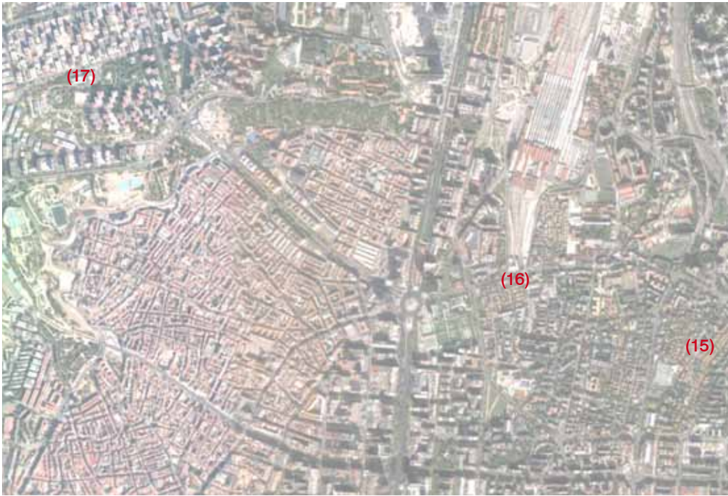
15 Centro de Rehabilitacion MUPAG: 1969-1973, Adress: C/ Madre de Dios 42 / Maestro Chapí 25.