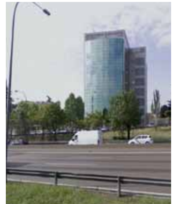
Huidige situatie Laboratorios Jorba

Centro de Rehabilitacion MUPAG: 1969-1973 (15)