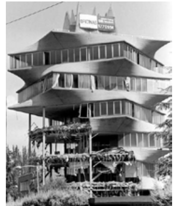
Laboratorios Jorba 1965-1967 (22)

De expressie van de ruimte, en de materialen is in het werk van Fisac altijd nauw verbonden met de techniek. Interessant is dat innovatie en het experiment heel belangrijk zijn in het werk, maar dat hij tegelijkertijd zijn ontdekkingen tientallen jaren gebruikt en door ontwikkelt. Voor de uitvindingen vroeg hij talloze patenten aan. De Fisac steen, verschillende betonliggers, het flexibele bekistingssysteem. Miquel Fisac liet een enorm oeuvre na. Hij ontwierp tussen 1941 en 2003 ruim 130 gebouwen, waarvan 57 in Madrid. In 2007 maakt ik een kleine reisgids voor 23 werken van Miquel Fisac in deze stad. Het gidsje is nu, in iets aangepaste vorm, het openingsnummer van de reeks Local Heroes.