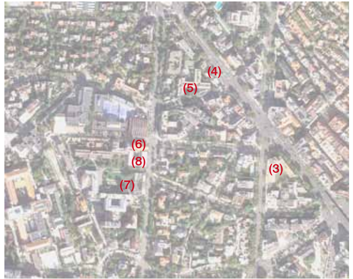
01 CISC Libreria Cientifica 1950 Adress: Calle de Duque de Medinacelli 4