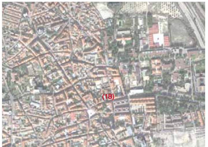
19 Polideportivo Sportscenter 2003 Adress: Carretara de Leganés, Getafe (Madrid 15 km)